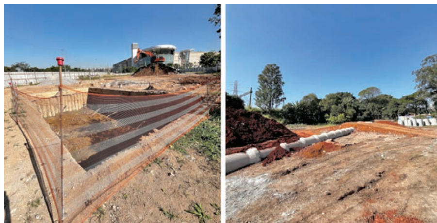
Obras devem ser concluídas no final do ano

Com o avanço das obras, os moradores da Lapa e de Pirituba têm manifestado preocupação com o fluxo do trânsito desembocando da nova ponte para a Avenida Raimundo Pereira de Magalhães antes que a via esteja duplicada e