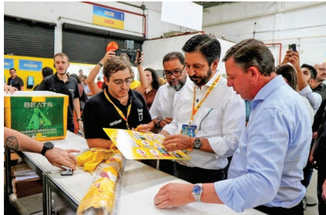
Kits foram entregues a 15 mil ambulantes

Os ambulantes receberam um kit completo de trabalho, com credencial, colete, guarda-sol, isopor e boné, além de participarem de capacitação gratuita, com orientações sobre atendimento ao público, técnicas de venda, atuação regularizada e con-