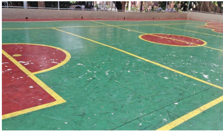
Praça Francisco Matarazzo tem piso da quadra descascado