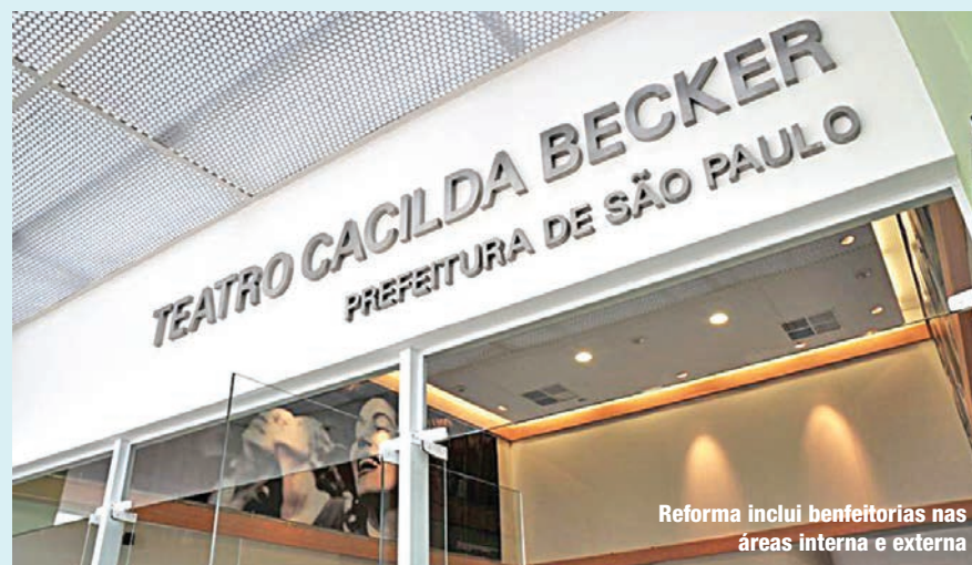
Reforma inclui benfeitorias nas áreas interna e externa