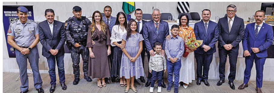
Família Telhada comparece à homenagem na Assembleia Legislativa

Proponente da homenagem, o deputado Capitão Telhada (PP) destacou o caráter institucional da condecoração e afirmou que a medalha representa um reconhecimento ao trabalho dos policiais que integram a unidade. O parlamentar enalteceu o papel do batalhão em “servir o povo do bem todos os dias, em prol do Brasil e da liberdade”.