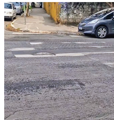
Serviço começou próximo ao prédio dos Correios e irá até a Queiróz Filho