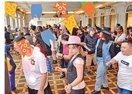
Baladown Junina na União Fraterna

Na Paróquia São João Maria Vianney (Praça Cornélia – Água Branca) as quermesses acontecem no sábado, 20, das 14h às 22h, e domingo, 21, das 10h às 21h. Na região da Leopoldina, Alto da Lapa