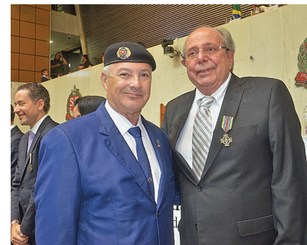
Gerson Nunes com Coronel Telhada